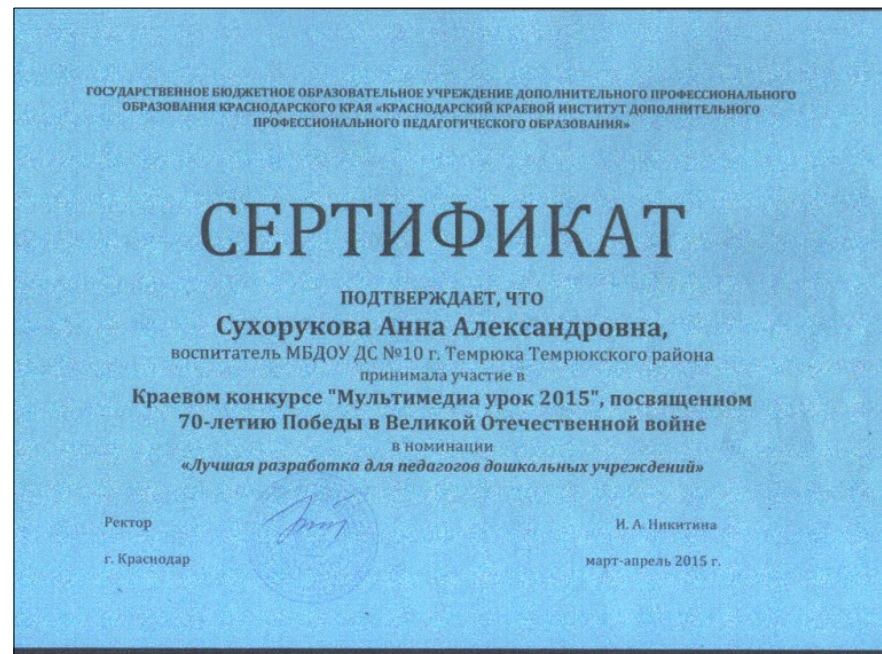
Участие в краевом конкурсе «Мультимедиа урок 2015»