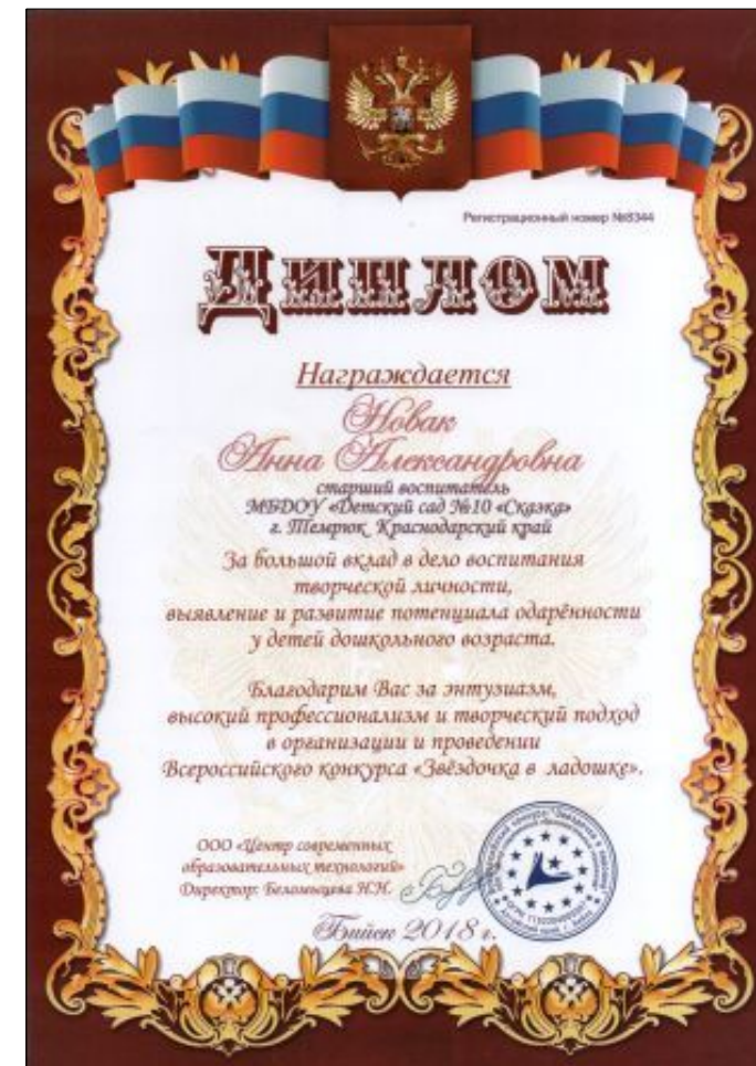
Всероссийский конкурс «Звездочка в ладошке»